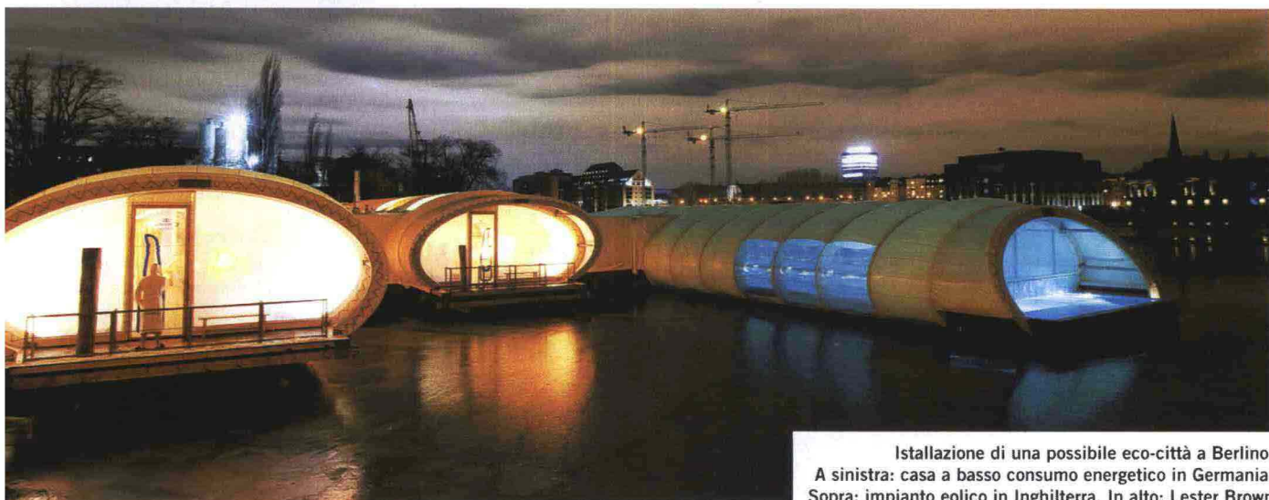
Istallazione di una possibile eco-città a Berlino. A sinistra: casa a basso consumo energetico in Germania. Sopra: impianto eolico in Inghilterra. In alto: Lester Brown